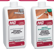
HG P54 HG P55