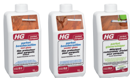
HG P51 HG P52 HG P53